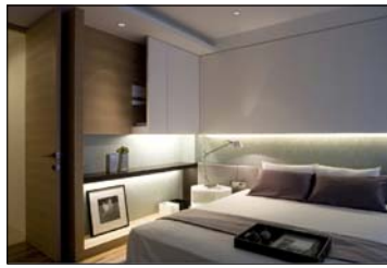
主臥房床頭示意圖